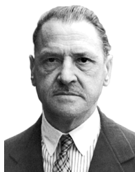
Сомерсет МОЭМ (1874 – 1956)