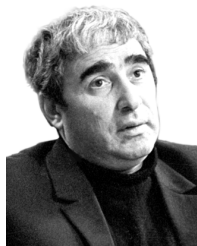
Нодар ДУМБАДЗЕ (1928–1984)