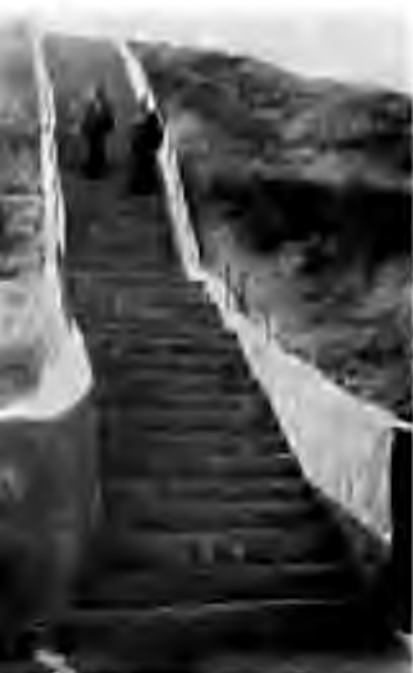
Лоткон тепага чиқиш йўли.