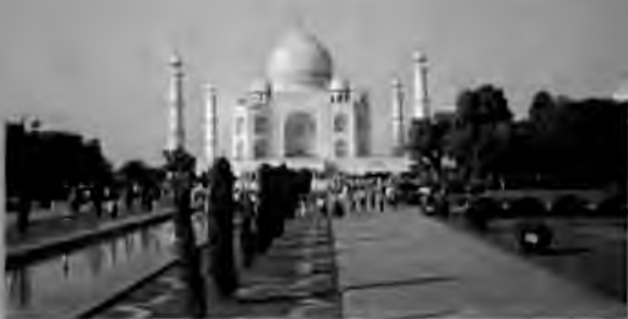
Тожамаҳал. Бобурийлар сулоласидан қолган аjoyиб ёдгорлик.