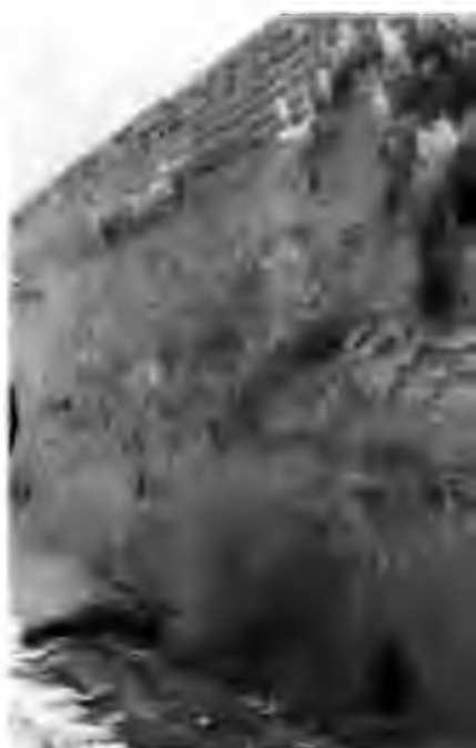
Арк девори қолдиқлари.