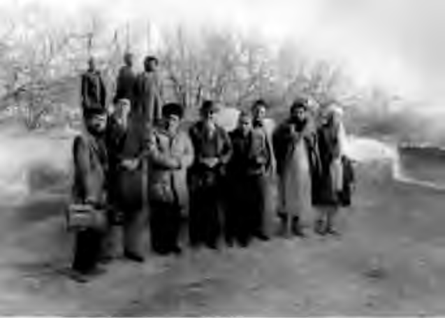
Экспедиция аъзолари Афғонистонда.