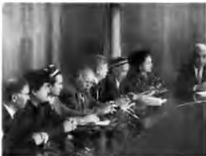
Бобур таваллудининг 510 йиллигини нишонлаш комиссиясининг йиғилиши.